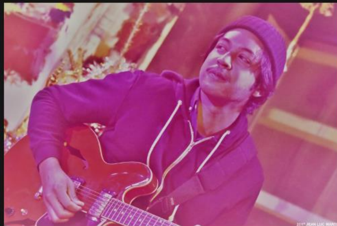
ATRISMA AU BAR AION A LA ROCHELLE LE 6/01/2017