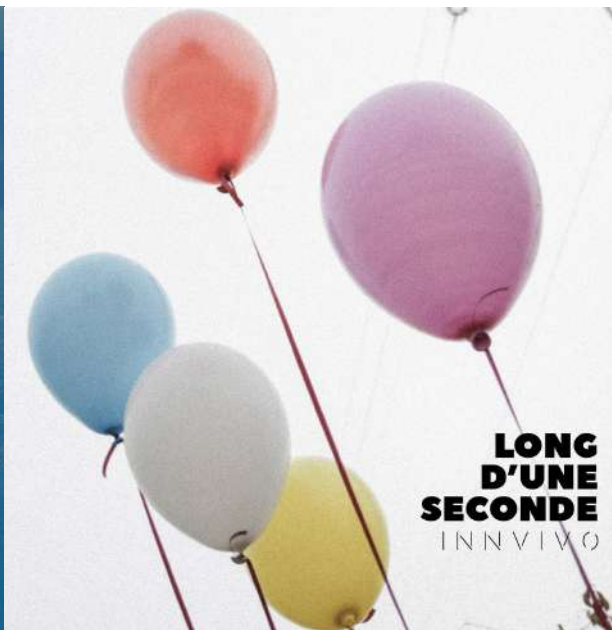
LONG D'UNE SECONDE, 2017