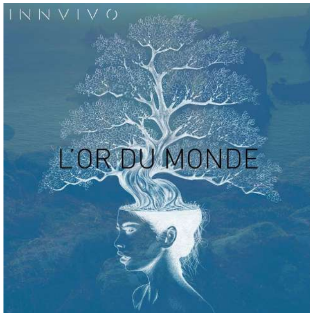
L'OR DU MONDE, 2015